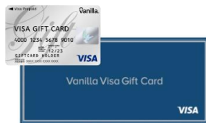
バニラ Visa ギフトカード